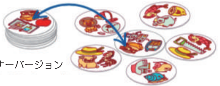
ビギナーバージョン

全てのトークンを絵の方を上にしてテーブルに置きます。プレイヤーの目的は、同じ絵のトークンを見つけ、ペアになるようにして自分のそばに置くことです。