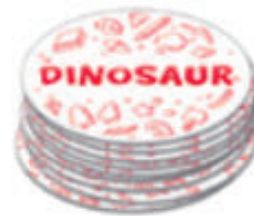
長い単語のセット