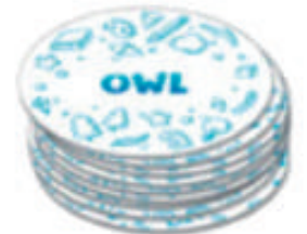
短い単語のセット